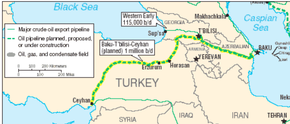
(Bakü-Tiflis-Ceyhan Boru Hattı)

Türkiye'nin coğrafi özellikleri de son derece kritiktir. 3 kıtanın kilit noktasında bulunan bir konuma sahip olan, bereketli yer altı ve yer üstü kaynakları bulunan Anadolu'nun üzerinden pek çok millet ve medeniyet geçmiş fakat bu coğrafyada tutunamamışlardır. Coğrafi özelliklerimizin doğru analizi yapılır ve doğru milli politikalar izlenirse, Türkiye küresel güç haline gelebilir. Fakat nihayetinde yine coğrafyamızdan ötürü gözlerin sürekli üzerimizde olduğunu da unutmamamız lazım.