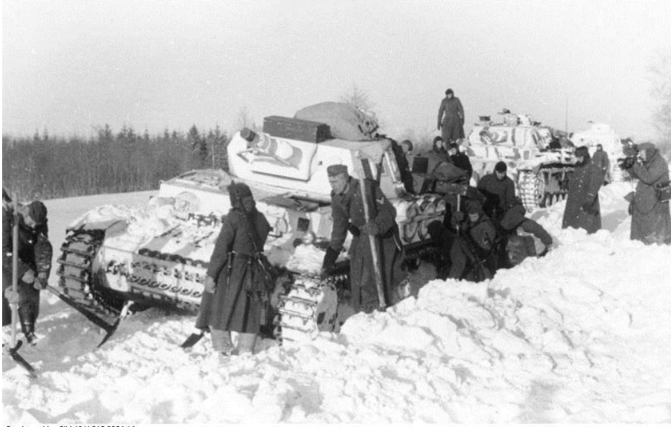
1941 Ende

Bir başka örnek olarak; 2. Dünya Savaşı'nda Almanya, Stalingrad'a girdiğinde Rusya'nın coğrafi olarak geniş ve özellikle kuzey bölgelerinde kış aylarının çetin geçtiğini hesaba katamamış, kusursuz denecek bir orduyu Moskova'ya gönderirken helak etmiş ve savaşın ibresi Almanya'nın aleyhine dönmüştür. Rusya'da kış ayının bu derece sert geçmesi pek çok Alman askerinin donarak ölmesine sebep olmuş ve bir dünya savaşının seyrine dahi yön vermiştir.